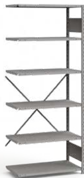
SRB1011 Unité d'ajout

VOICI QUELQUES-UNS DES MODÈLES D'ÉTAGÈRES SIMPLES, OUVERTES OU FERMÉES LES PLUS POPULAIRES.