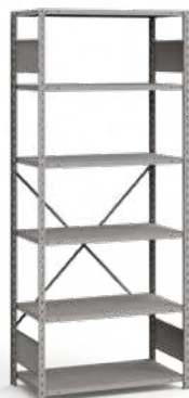
SRE1011 Unité de début