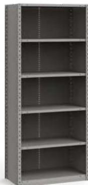
SRE2011 Unité de début