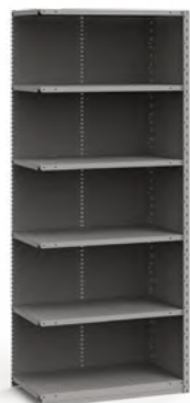
SRB2011 Unité d'ajout