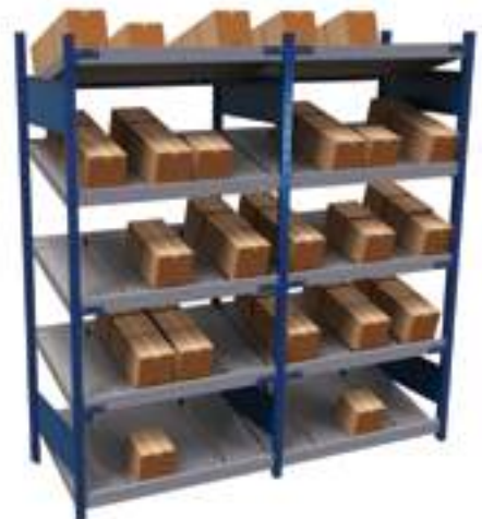
SRE1F-EE750501 + SRG1F-EE750501

Les tablettes inclinées optimisent la visibilité des objets sur les tablettes situées au-dessus du niveau des yeux de l'utilisateur. Pour les tablettes situées sous ce niveau, l'ajout d'un angle réduit la visibilité du contenu. Si la visibilité prédomine sur la fonction de gravité, nous vous recommandons de mettre les tablettes inférieures à angle droit (SH20/21).