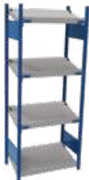
SRK1F-DC750401 Unité indépendante