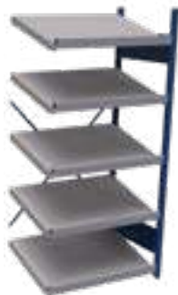
SRB1T-EE750501 Unité d'ajout