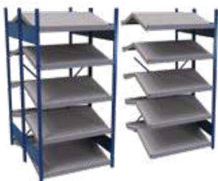
SRE1T-EE751001B Unité de début