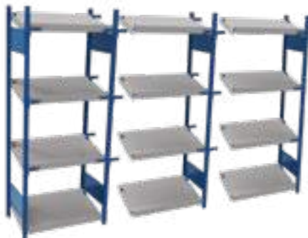
SRE1F-DC75041 Unité de début