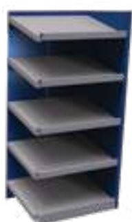
SRB2T-EE750501 Unité d'ajout