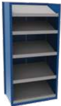
SRE2T-EE750501 Unité de début