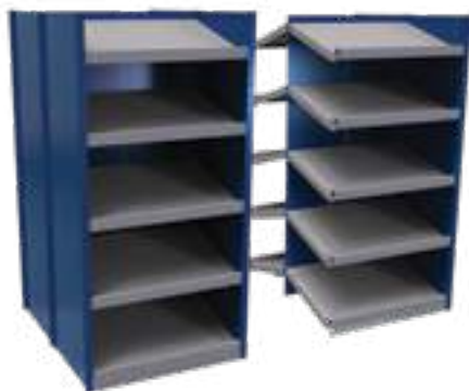
SRE2T-EE751001B Unité de début