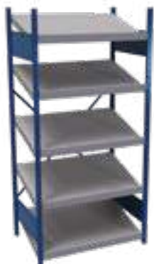
SRE1T-EE750501 Unité de début