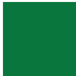
Vert Nature Lustré 1025