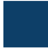
Bleu Minuit 057