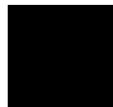
Noir Lustré 902

POUR ENCORE PLUS DE DISTINCTION, COMBINEZ DEUX OU PLUSIEURS COULEURS. VOICI QUELQUES EXEMPLES :