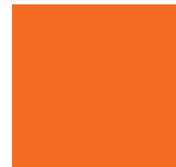
Orange Sienna 085