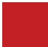
Rouge Carmine Lustré 806