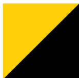
Jaune Lustré / Noir Lustré 208/902