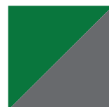
Vert Nature Lustré / Gris Charbon 1025/072