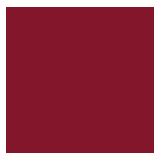
Rouge Canneberge Lustré 815