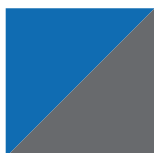
Bleu Avalanche / Gris Charbon 055/072