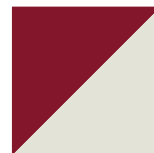
Rouge Canneberge Lustré / Blanc Givre 815/061