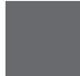
Gris Charbon 072