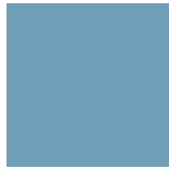
Bleu Everest 051

AVOIR LA POSSIBILITÉ DE PERSONNALISER VOTRE PRODUIT ROUSSEAU AVEC L'UNE DE NOS VINGT COULEURS STANDARDS, C'EST AUSSI ÇA, LA DIFFÉRENCE ROUSSEAU!