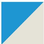
Bleu Classique / Blanc Givre 052/061

POUR ENCORE PLUS DE DISTINCTION, COMBINEZ DEUX OU PLUSIEURS COULEURS. VOICI QUELQUES EXEMPLES :