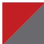
Rouge Carmine Lustré / Gris Charbon 806/072