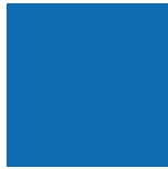
Bleu Avalanche 055