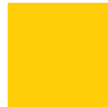
Jaune Lustré 208