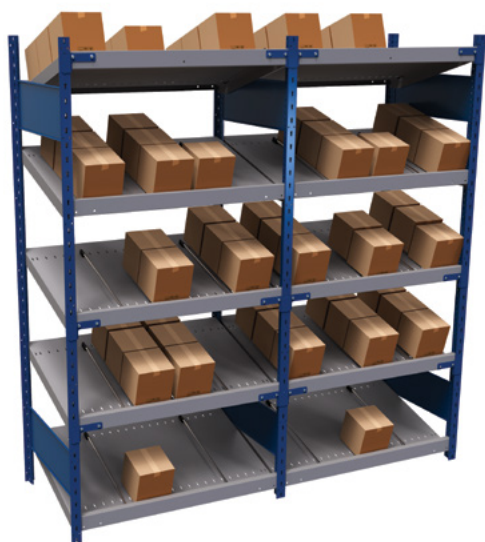
SRE1F-EE750501 + SRG1F-EE750501